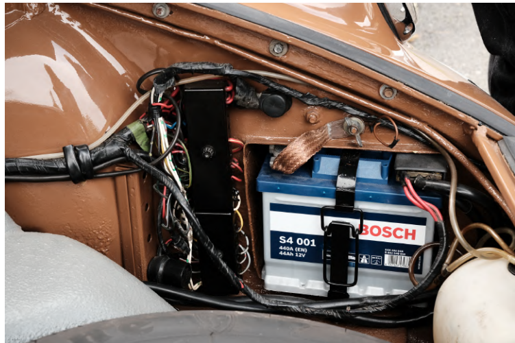
Ici on peut voir que l'auto a vraiment été soignée jusque dans les moindres recoins.